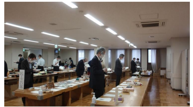
< 審査風景 >