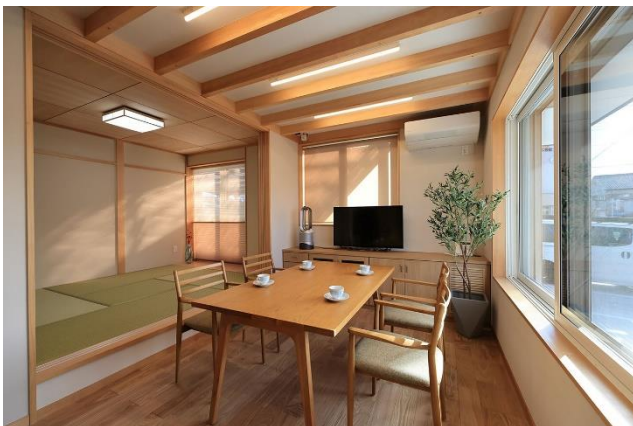
【健康・省エネリフォーム 体感ギャラリー】