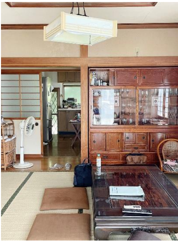
【リフォーム前】 （昭和の住宅：すき間風も入る、茶の間とキッチン）