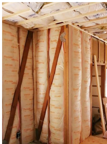
【リフォーム工事中】 （間仕切壁を取って断熱×耐震工事）