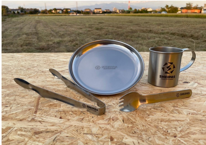
■水だけでキレイになる食器(全4種)

群馬県発祥の新アウトドアブランド「SNEIPAS」より、自然を愛するキャンパーを対象に販売開始。